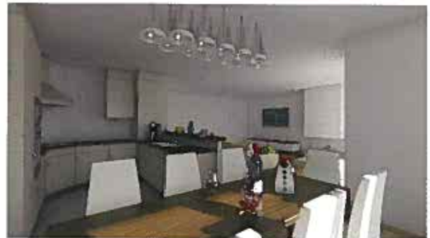
Vues intérieures des appartements The Lodge