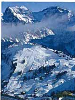
Pistes de course et snowpark de Champéry

Pour plus d'informations visitez www.champerylodge.ch